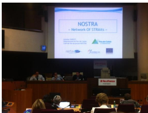
Présentation du projet NOSTRA au séminaire national Interreg Europe en France