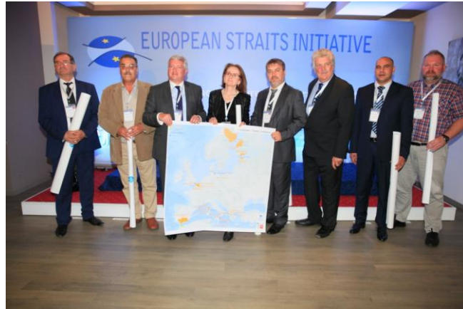
Conférence de Vlora

Cette rencontre, qui s’est clôturée par une conférence de presse avec de nombreux journalistes albanais, a notamment permis aux participants de mieux appréhender les enjeux spécifiques au détroit d’Otrante et à la région de Vlora, l’Albanie ayant officiellement acquis le statut de candidat à l’Union européenne.