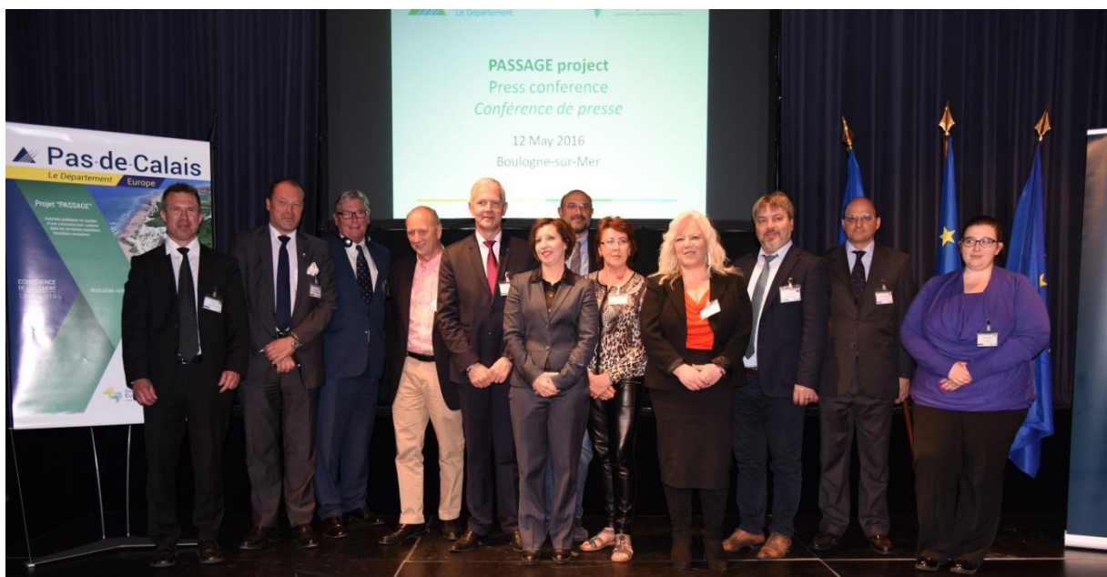
Les partenaires du projet PASSAGE lors de la conférence de lancement

Un premier séminaire technique s'est déroulé dans le détroit de Fehmarn du 6 au 8 septembre 2016 , à l'invitation de Femern Belt Development. Cela a été l'occasion pour les 11 partenaires de partager les principales problématiques liées aux émissions carbone dans leur région et de discuter des possibilités de financement d'initiatives bas-carbone offertes par les programmes Interreg V A recouvrant leurs régions maritimes frontalières. Une visite de terrain incluait la visite d'une usine de fabrication de sucre de betteraves et de Femern A/S, l'entreprise en charge du développement du projet de tunnel entre le Danemark et l'Allemagne.